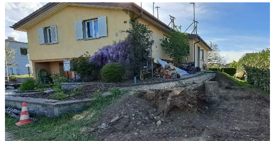
Aktuell (noch im Bau)